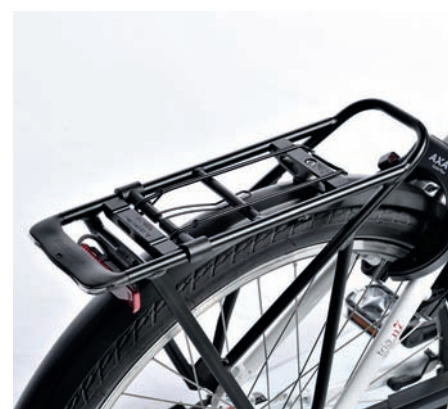
Racktime Gepäckträger für 25 Kilo Last mit integriertem Rücklicht.