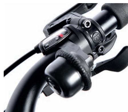
Kleine Daumenbewegung, heller Klang: Die Glocke wird zum Läuten gedreht.