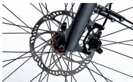
Hydraulische Scheibenbremse Magura MT2 mit zwei Kolben.

W inora-Staiger erfüllt optisch mit dem Sinus Tria 10 die Bedürfnisse des Zeitgeistes. Dunkles Grau ziert den Rahmen, die Komponenten sind alle mattschwarz. Mit der grauen Farbgebung kommen die Schweißnähte des Rahmens besonders zur Geltung. Zu unserer Freude sind diese sauber und fachgerecht aufgesetzt. Der Akku sitzt optisch gelungen semiintegriert auf dem Unterrohr des Rahmens. Für Komfort sind die Suntour-Federgabel und die Federsattelstütze zuständig. Ebenfalls zur Entspannung dienen der leicht gekröpfte Lenker mit ergonomischen Griffen. Der Bosch „Performance“ mit 60 Nm Drehmomentspitze hat auch für steile Bergpassagen ausreichend Power. Mit Magura Scheibenbremsen sollte das Sinus sicher zum Stillstand kommen.